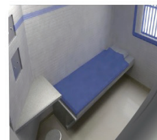
Typical wide angle camera. Big blind spots in 4 corners of FOV